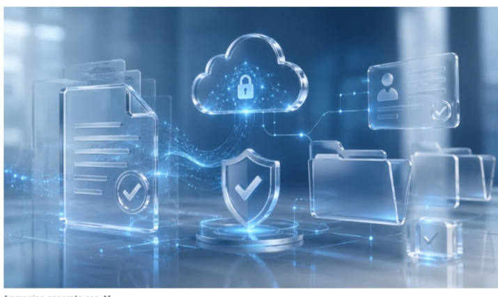
Immagine generata con AI