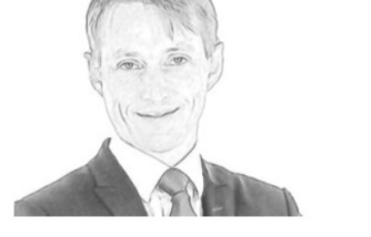
LMCR ha assistito Mercurio Industrial Group e Strada Partners, Russo De Rosa Associati ha assistito Mercurio Industrial Group, DG Legal Consulting e Usioni &...